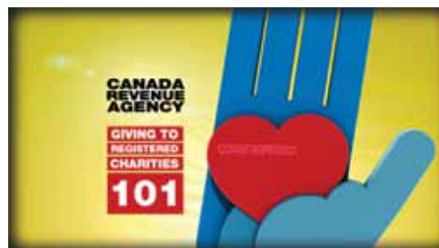
「向慈善機構捐贈101」影片系列